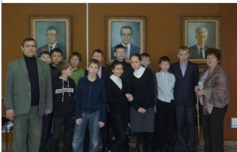
В музее ОАО «Химпром»