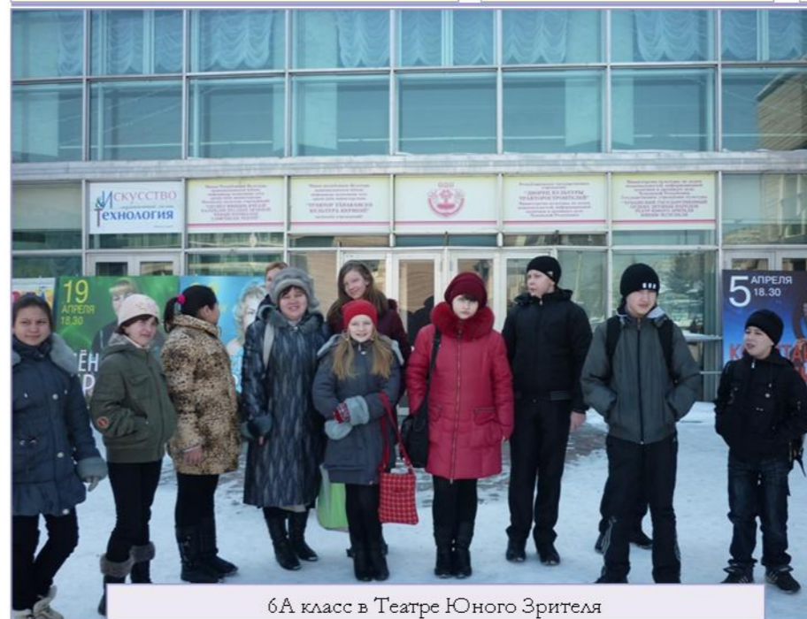
6А класс в Театре Юного Зрителя

Полианна помогла и всем нам взглянуть на многое с позиции "Радуйся". Этот спектакль побуждает к жизни, полной радости, несмотря на все её трудности и огорчения. Стоит задуматься: "А стоит ли огорчаться, когда есть повод радоваться окружающему вокруг нас миру?" Ищите во всем позитив! Радуйтесь!