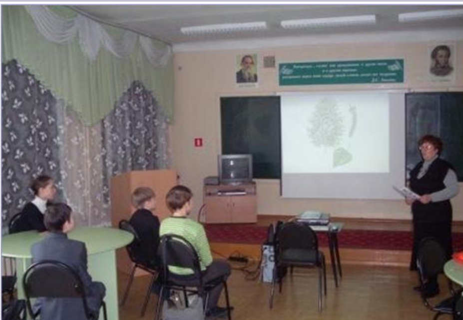
7а класс на викторине "Знатоки природы"