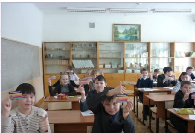
Математический Конкурс "Кенгуру-2012"

Ребята с огромным вниманием следили за драматическими сценами из жизни 11-летней девочки Полианны. Спектакль затронул юные сердца ребят и их родителей, что поехали вместе с нами в театр. Ведь героиня спектакля учит радоваться всему. И даже страшная трагедия во время аварии не сломи-