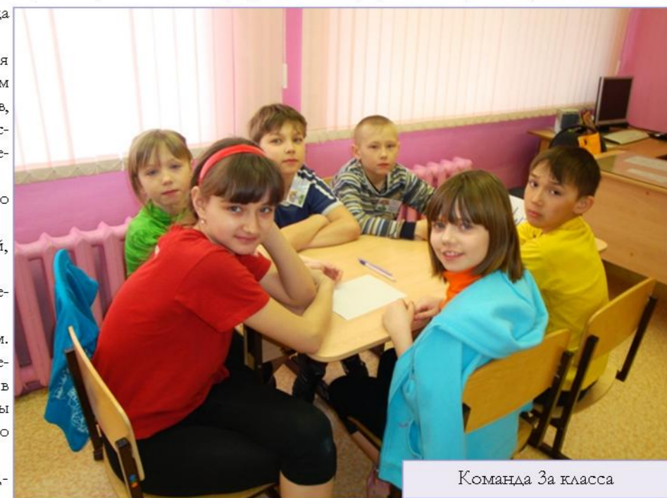
Команда 3а класса

30 марта в школе № 17 состоялся финальный этап городского интеллектуально-спортивного марафона «Я расту здоровым и счастливым!» среди учащихся 3-их классов. Юные марафонцы школы № 1 встретились с сильнейшими командами своих ровесников из школ №№ 16 и 17. Напомним, что команда младших школьников школы № 1 «Радуга» стала лучшей в отборочном этапе конкурса (борьба за выход в финал марафона велась с командами школ №№ 2,3,4,5,10,11). Свое выступление ребята начали с творческой презентации, а затем приняли участие в интел-