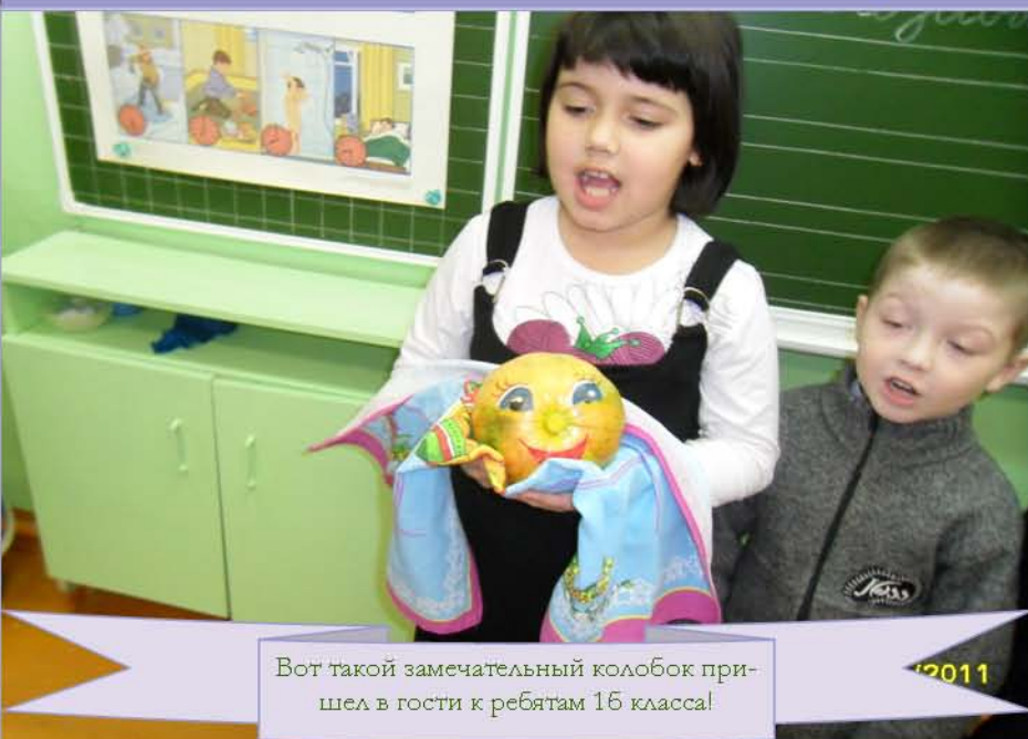
Вот такой замечательный колобок пришел в гости к ребятам 16 класса!