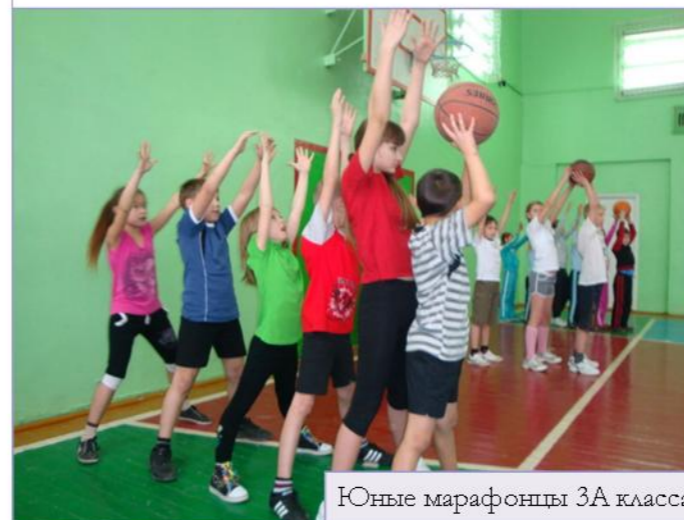
Юные марафонцы 3А класса

20 января в школе № 11 состоялась отборочный этап городского интеллектуально-спортивного марафона «Я расту счастливым и здоровым» среди учащихся 3-их классов. Команда младших школьников школы № 1 «Радуга» вступила в борьбу за выход в финал марафона с командами школ №№1,2,3,4,5,10,11. Своё выступление ребята начали с творческой презентации, а затем приняли участие в интеллектуальном и спортивном командных конкурсах. В ходе соревнования ребята их школы № 1 показали лучшие интеллектуальные способности и спортивные качества. Теперь юные марафонцы встретятся с сильнейшими командами своих ровесников в финале, который состоится в марте.