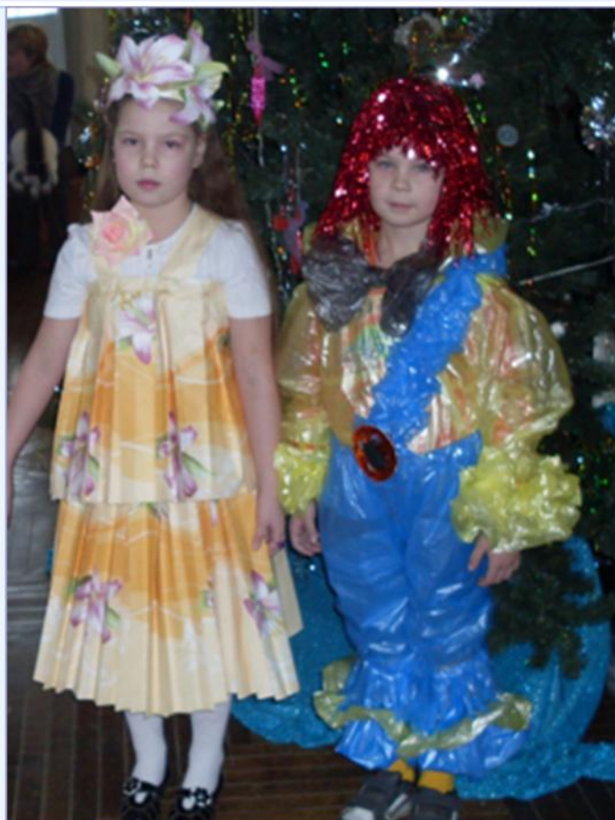
Учащиеся 2А класса

Хорошее, легкое и праздничное настроение царило в этот день на импровизированном параде. Все учащиеся были безумно довольны концерту.